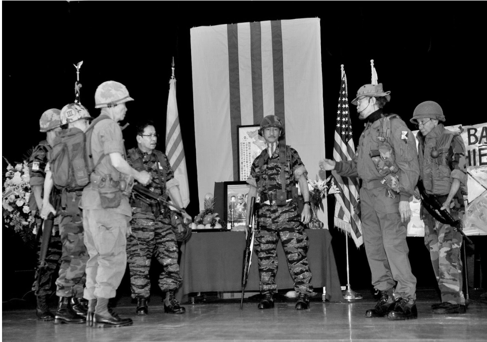
Một cảnh trong vở Bi Hùng Kịch: TRÁI LỰU ĐẠN CUỐI CÙNG do tập thể Quân cán Chính VNCH/OR trình diễn năm 2019.