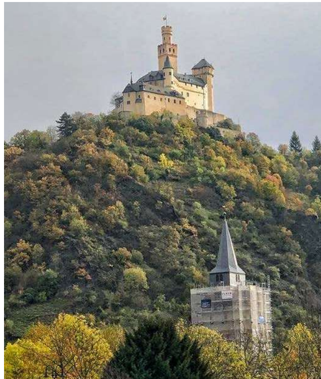
Lâu đài trên đỉnh cheo leo Chân đi từng bước cũng trào đến nơi